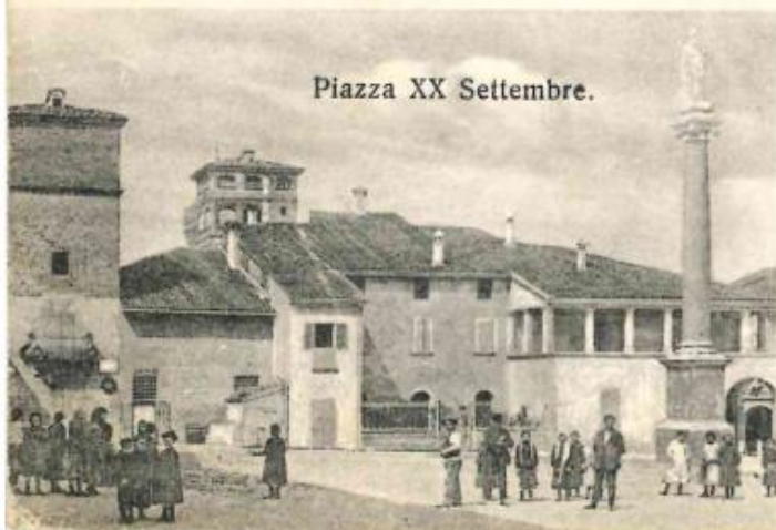
Castel s. Pietro (Emilia).